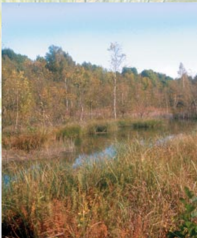
Tremblant sur l'étang Saint-Ladre

La vallée de l'Avre s'est inscrite dans le plateau crayeux picard lors de glaciations, alors que la rivière avait un cours torrentueux. Plus tard, lorsque le niveau de la mer est remonté, la végétation s'est accumulée sans se décomposer dans le lit majeur inondé de la rivière, formant la tourbe.