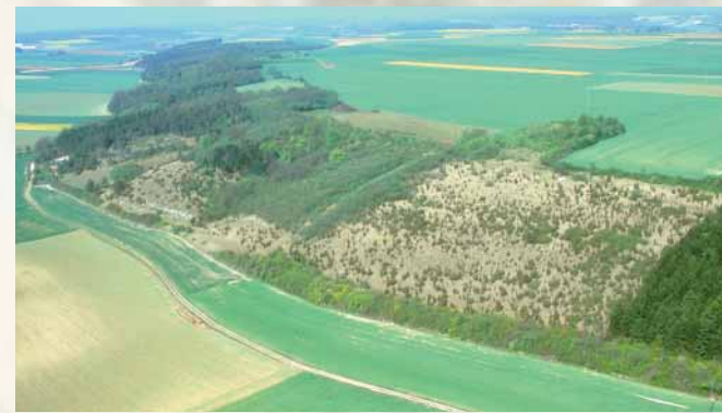
Vue aérienne du larris.

La "Montagne de Montenoy", dont les pentes sont orientées à l'Ouest, domine la petite vallée sèche dite "de la Terrière". En serré de champs cultivés, ce "larris" (terme picard désignant les étendues herbeuses sur pentes crayeuses) constitue un "écriin de nature" d'une grande originalité, façonné par l'Homme.