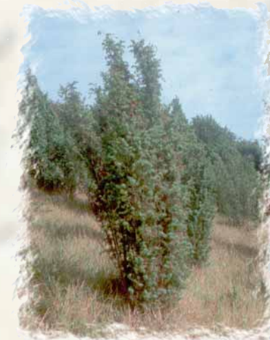
Par leur port droit et élancé, les genévriers contribuent à l'originalité paysagère du site, rappelant certaines ambiances du Sud de la France.