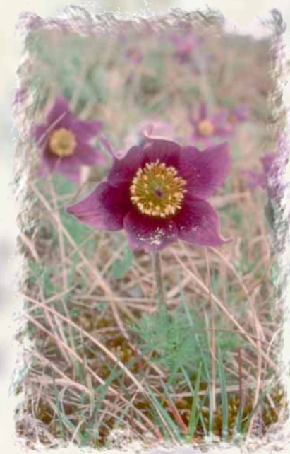
L'Anémone pulsatile, espèce emblématique des pelouses rases et ensoleillées, est présente ici en densité spectaculaire. Elle fleurit au mois d'avril.

Afin d'enrayer cette évolution, un pâturage par des moutons a été rétabli en 1997 en collaboration avec un éleveur local. Cette pratique extensive est associée à des chantiers de coupe et de débroussaillage. Des opérations visant à favoriser le retour du lapin sur le site sont également entreprises.