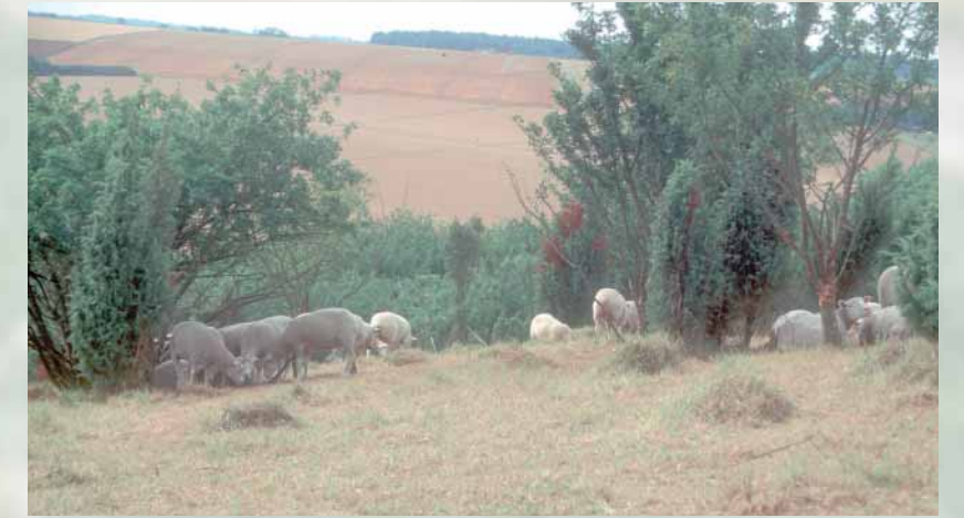
Une quarantaine de moutons entretiennent le larris chaque année pendant les mois d'été.

Jusque dans les années 1950, la "Montagne de Montenoy" était pâturée par des vaches et des moutons conduits en estive par un berger communal. Suite à l'abandon du pâturage, les herbes hautes et les arbustes (les genévriers principalement) ont progressivement recouvert le larris. La faune et la flore typiques des espaces ensoleillés et peu embroussaillés, ont ainsi fortement régressé. Dans un même temps, le nombre de lapins, qui contribuaient aussi au maintien des secteurs d'herbes rases, a fortement chuté suite à l'épidémie de myxomatose apparue dans les années 1950.