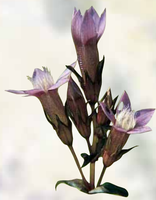
La Gentiane d'Allemagne fleurit à la fin de l'été sur la végétation rase des pentes.

La "Montagne de Montenoy", dont les pentes sont orientées à l'Ouest, domine la petite vallée sèche dite "de la Terrière". En serré de champs cultivés, ce "larris" (terme picard désignant les étendues herbeuses sur pentes crayeuses) constitue un "écriin de nature" d'une grande originalité, façonné par l'Homme.