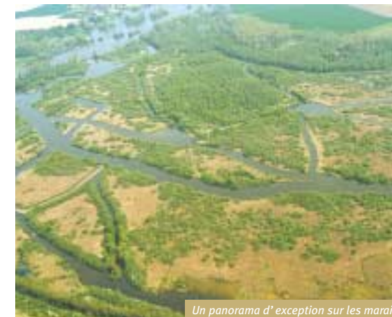
Un panorama d'exception sur les marais

Pour bénéficier du point de vue sur le larris, suivez la petite sente qui part sur la gauche du belvédère. Au bout du sentier, après la chapelle de Notre-Dame-de-