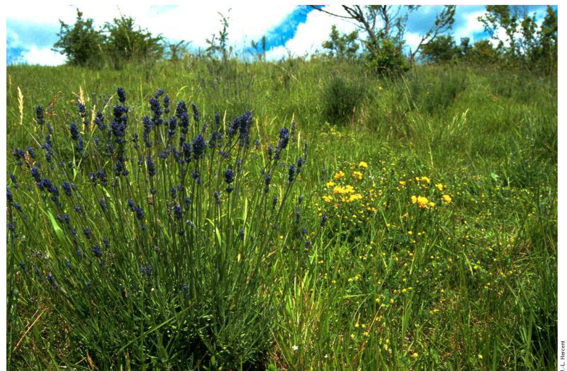
A intervalles plus ou moins réguliers, cette colline a été cultivée. Au début du siècle, la culture de la lavande a même été tentée. Quelques pieds subsistent encore sur son versant sud.