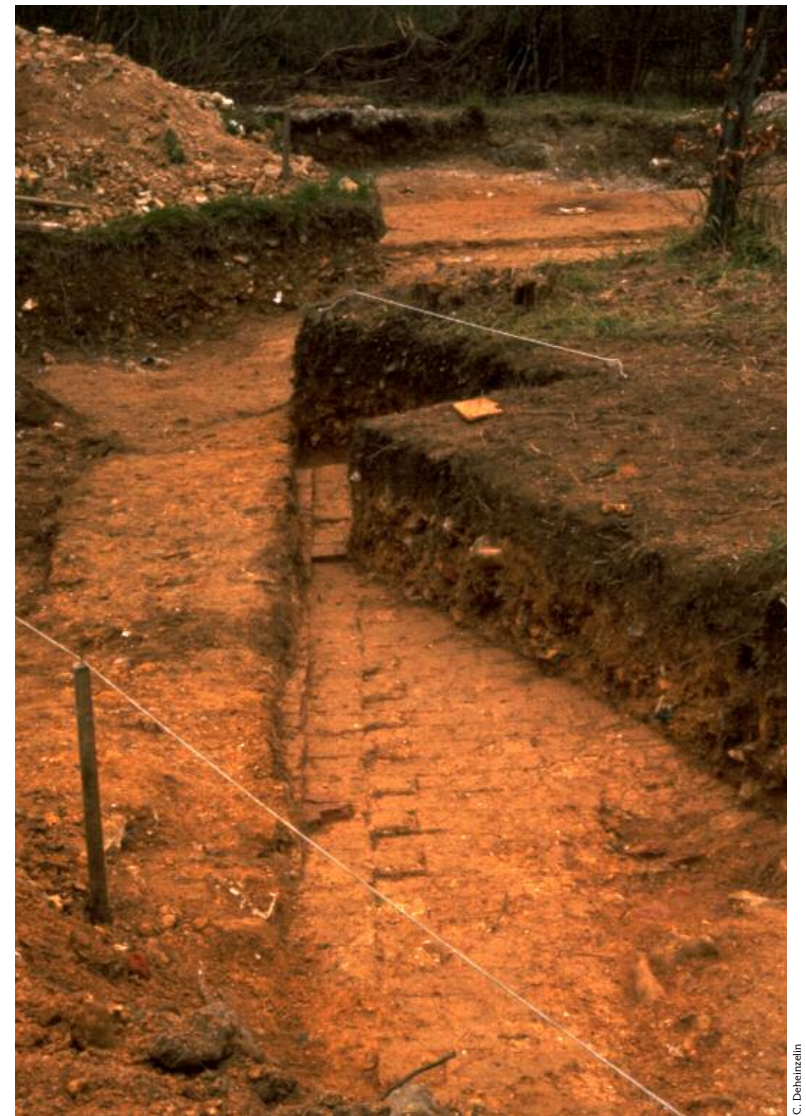
Le sol de la chapelle du XVI e siècle était pavé de briques, de part et d'autre d'une allée centrale aménagée avec des carreaux hexagonaux

La destruction de la chapelle n'arrêta pas pour autant les pèlerinages très fréquentés par les populations locales. La dernière procession qui ne regroupait plus que les paroissiens de Saint-Pierre-ès-Champs eut lieu en 1957.