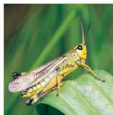
Le Criquet ensanglanté, insecte rare et menacé, est une remarquable illustration de la richesse faunistique des prairies pâturées.

La diversité des milieux présents sur le site des Pâtures permet l'accueil d'une faune très variée. Grâce au pâturage, les prairies sont très riches en sauterelles et en criquets.