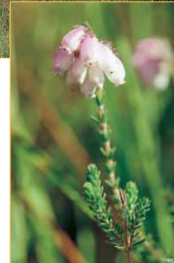
La Bruyère à quatre angles est caractéristique des landes humides. Rare et protégée, elle constitue des "tapis" de couleur rose bien visibles sur les secteurs de landes.

Les plantes intéressantes sont toutes liées à la présence d'un sol acide et humide. Les conditions relativement difficiles du milieu (sol pauvre en éléments nutritifs, inondation une partie de l'année...) ne permettent qu'à une flore originale et adaptée de croître. Ces particularités expliquent la présence d'une quinzaine d'espèces rares ou exceptionnelles.