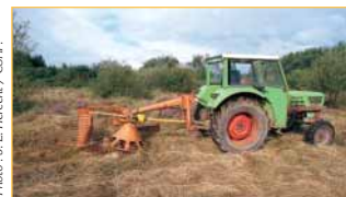
Le rajeunissement des prairies et des landes s'effectue notamment par une fauche mécanique.

Le site comprend de larges surfaces de pâtures ponctuées de secteurs de landes humides. Les landes se trouvent sur des sols pauvres et acides où vit une végétation constituée d'arbrisseaux bas comme les bruyères et les ajoncs. De par leur rareté dans le nord de la France, elles confèrent au site une grande importance pour la diversité biologique. Ces landes ne sont qu'une étape dans l'évolution spontanée des milieux et tendent, à long terme, à se boiser si aucun entretien ne vient les "rajeunir".