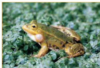
Les batraciens sont d'excellents indicateurs de la qualité des zones humides. Plusieurs espèces, dont la Grenouille verte, cohabitent sur le site.

Au moins 54 espèces d'oiseaux ont été observées, dont la Bécasse des bois, le Courlis cendré et la Bécassine des marais qui fréquentent le site une partie de l'année.