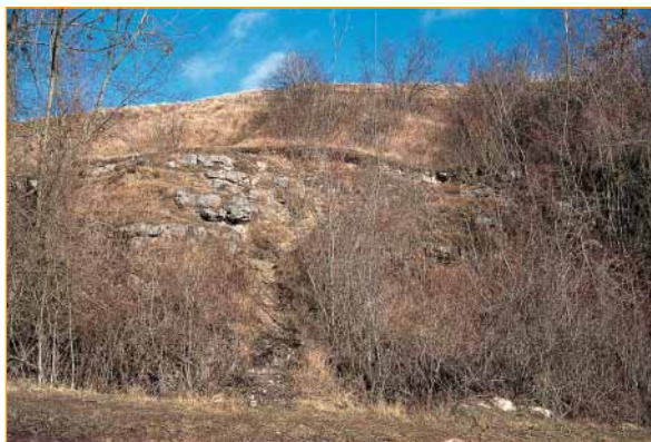
Les pentes qui bordent le Plateau sont en majorité boisées. Il subsiste néanmoins des pelouses rases intéressantes entre les affleurements de calcaire.

C'est la mosaïque des milieux naturels qui caractérise le Plateau de Lavilletterte et lui procure toute sa richesse. Elle permet à de nombreuses espèces d'y trouver le gîte et le couvert. Dès le printemps, une promenade discrète et attentive permet des rencontres avec des criquets et des sauterelles affairés dans les herbes rases ou avec des papillons impatients de profiter du nectar de chaque fleur. Une agitation dans une touffe d'herbes trahit la présence du Lézard vert, venu prendre un bain de soleil.