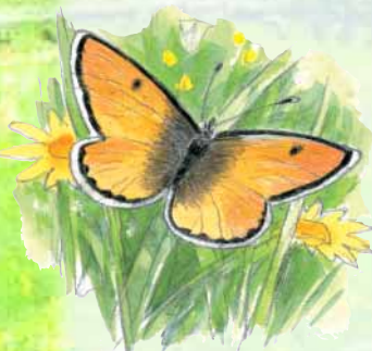
Le Cuivré des marais

La moyenne vallée de l'Oise, entre La Fère et Thourotte, est une zone humide exceptionnelle ; l'Etat l'a désignée comme Zone de Protection Spéciale (ZPS) auprès de l'Union Européenne.