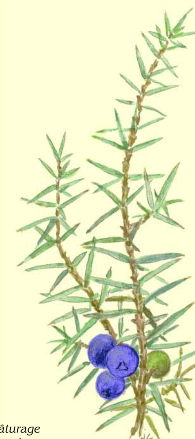
Hérité du pâturage et favorisé par les moutons, le Genévrier est encore présent sur le coteau. Son bois dur et presque imputrescible fut jadis utilisé pour la fabrication de divers outils.