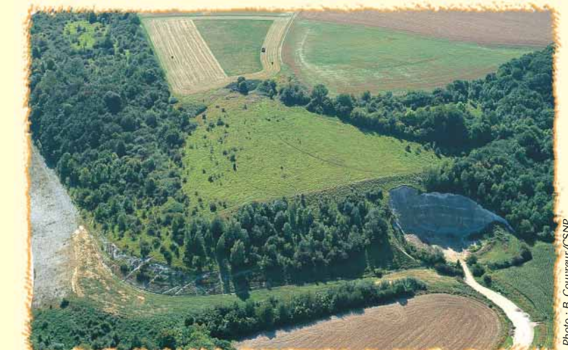
Une vue aérienne de la partie est du site, à proximité de l'autoroute, nous montre la juxtaposition des fourrés denses, des boisements et des pelouses plus rases. Ce "triangle" dégagé, en proie à l'envahissement par les fourrés, nécessite un pâturage régulier.