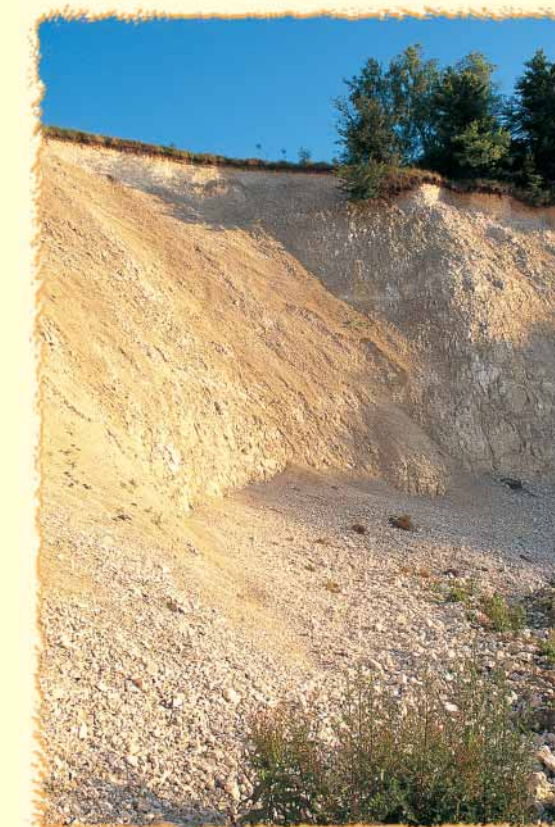
La grande marnière a longtemps servi pour l'extraction de la craie en vue de "marner" les champs alentour. Dangereuse et soumise aux éboulements, elle présente néanmoins à sa marge des secteurs intéressants pour des plantes pionnières.

Des pelouses s'entrelacent dans des fourrés plus ou moins denses auxquels succède la forêt, fraîche et ombragée. Lorsque la craie affleure, des éboulements fréquents empêchent l'installation durable de la végétation. D'anciennes marnières entaillent également les versants des Larris d'Auteuil. Lorsqu'elles se sont stabilisées, les arbustes ont poussé et ont intégré ces blessures dans le paysage jusqu'à les rendre imperceptibles.