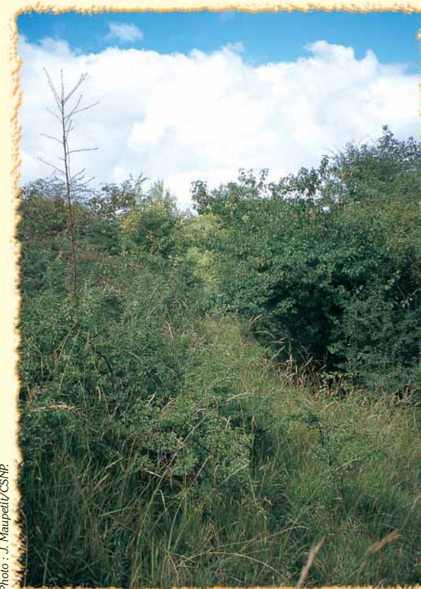
Un secteur embroussaillé et non pâturé : les cornouillers, les églantiers et les aubépines occupent le terrain. Les graminées, tel le Brachypode penné , y sont hautes et denses.

Le larris c'est aussi l'histoire des Hommes qui utilisaient le coteau pour faire pâturer chèvres et moutons. Ces derniers jouaient alors le rôle de tondeuses naturelles. Mais l'évolution de l'agriculture a peu à peu contribué à la diminution de l'élevage et à l'abandon des pelouses. Sans pâturage, les arbustes ont envahi les pelouses jusqu'à les étouffer. La faune et la flore associées aux pelouses ont ainsi presque disparu.