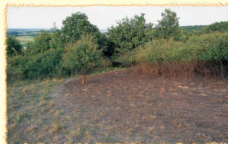
Un secteur pâturé : La végétation est maintenue rase par l'action des moutons. Ces derniers peuvent être rassemblés sur de petites surfaces, comme ici, lorsque la végétation est très dense.