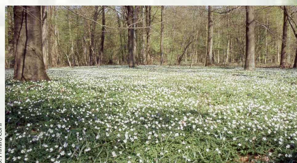
Hêtraie à Anémone sylvestris