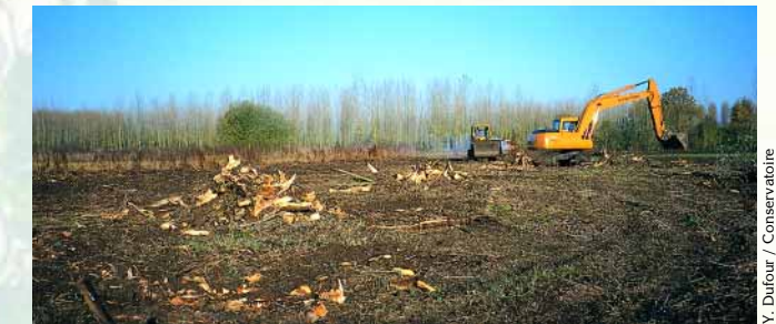
Le déboisement et le dessouchage, suivis de la mise en prairie ou en bande refuge ont permis d'augmenter l'attractivité du site pour la faune et de flore.