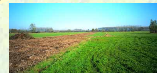
Un alignement de peupliers partageait le site en deux. La coupe des arbres et la réalisation d'une bande refuge ont permis de retrouver un espace dégagé.