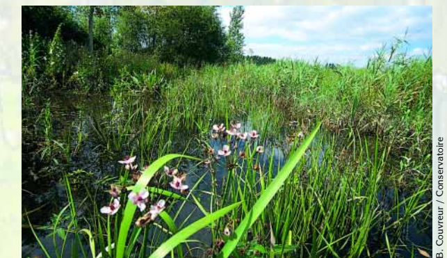
La restauration des mares et des fossés a très vite permis aux plantes caractéristiques des vallées inondables de se réimplanter. Les amphibiens et les oiseaux d'eau y trouvent aussi leur compte.