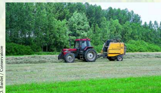
Une fauche tardive, fin juin, permet au Rôle des genêts ainsi qu'aux autres habitants des prairies de fauche de mener à bien leur reproduction. La flore en bénéficie également.