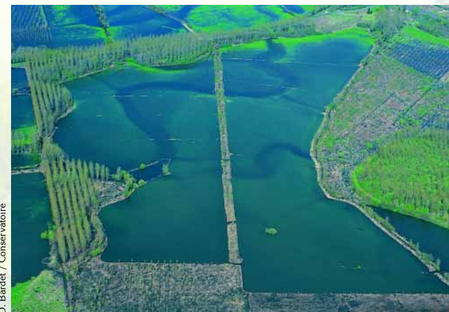
Vue aérienne réalisée en période d'inondation (avril 1998). A cette date, le site était bordé par des plantations de peupliers. En 1999, la coupe de ces arbres a permis d'ouvrir le paysage pour le rendre plus favorable au Rôle des genêts